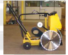
UNIDAD HIDRÁULICA PARA DOS HERRAMIENTAS SIMULTÁNEAS SIERRA DE CORTE ASFALTO