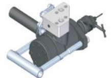
AMOLADORA HIDRÁULICA CARMARO HIDRÁULICO CAJONERÍA PARA HERRAMIENTAS