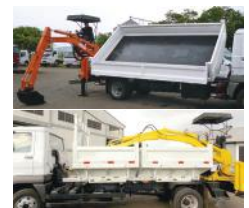
CAJA VOLCADORA BILATERAL (OPCIONAL BIPARTIDA)