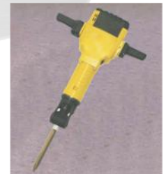
COMPACTADOR DE SUMERILLO MARTILLO HIDRÁULICO